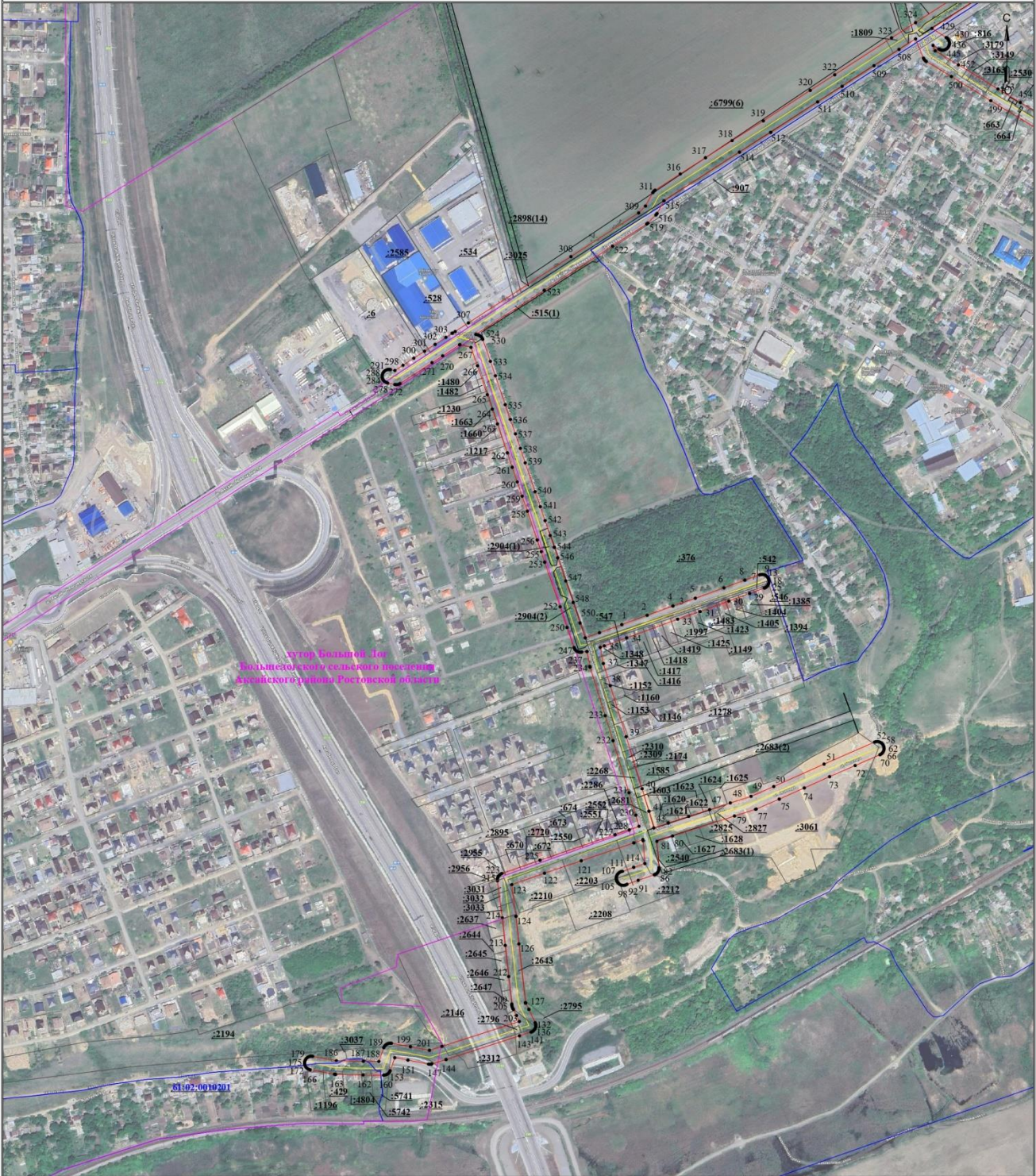
Схема расположения границ публичного сервитута для эксплуатации объекта В.Л-6 кв В.Л-801 ПС АС-8 (наименование объекта)